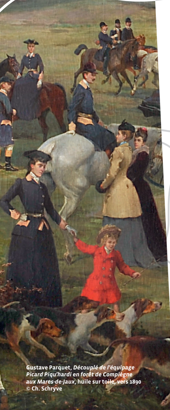
Gustave Parquet, Découplé de l'équipage Picard Piqu'hardi en forêt de Compiègne aux Mares-de-Jaux , huile sur toile, vers 1890