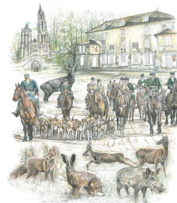
Jean Lamy, Sans titre , crayon sur papier, 2024 © J. Lamy