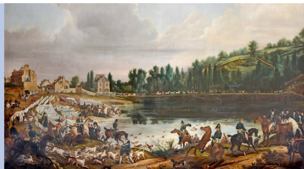
Carle Vernet (d'après), Chasse au daim pour la Saint-Hubert, en 1818, dans les bois de Meudon , huile sur toile, 1 ère moitié du XIX e s.